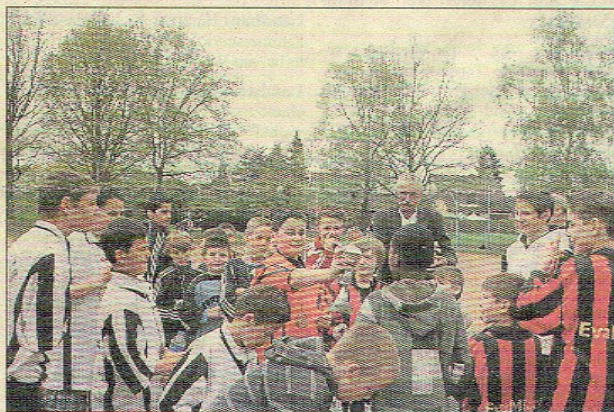
So ein Pokal ist für jeden ein toller Ansporn. Und wer leer ausgeht, will im nächsten Jahr wieder mit dabei sein.

schen vom Jugendbeirat und EvaMigrA veranstaltet. Als Sponsor traten in diesem Jahr der CDU-Ortsverband sowie die Firma FD-Pokale auf, die für die Jugendmannschaften Wanderpokale stifteten.