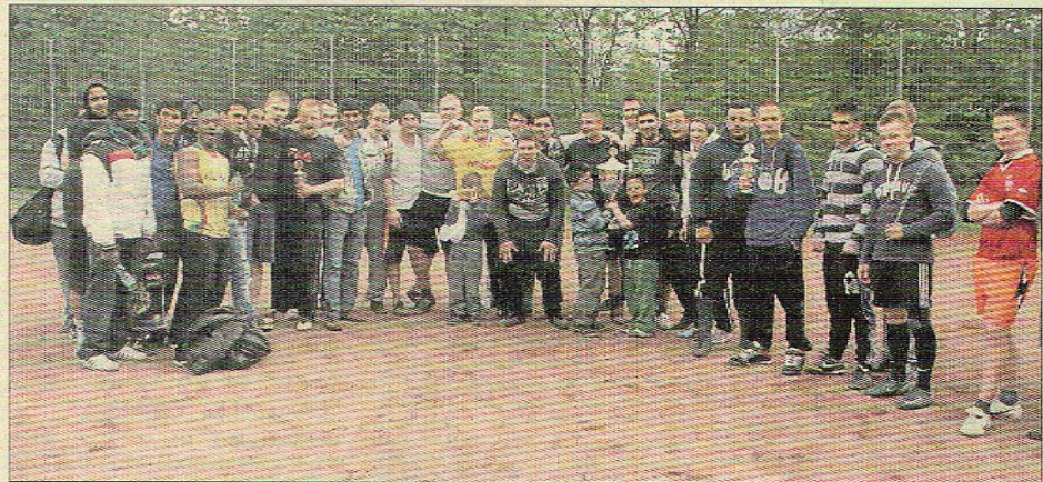
Viele Nationen waren in den Mannschaften von Jugendeinrichtungen beim Bolzplatzturnier vertreten.

In zwei Altersgruppen kickten die Kinder, Jugendlichen und Jungerwachsene verschiedenster Nationen. miteinander statt gegeneinander war das Motto des Fair Play Turniers. Sieger der Acht- bis Zwölfjährigen war in diesem Jahr der Jugendclub Container, der nicht zu bremsen war und verdient den Pokal einsammeln konnte. Alle Teilnehmer in dieser Altersklasse bekamen von Alex